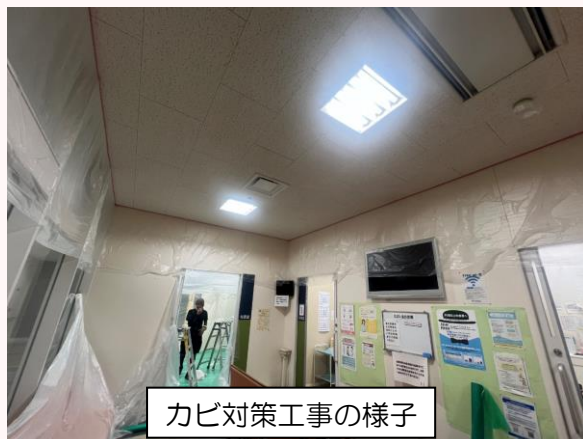
カビ対策工事の様子

カビ対策工事後は消毒用の薬品により臭いが残ることがあります。ご迷惑をおかけいたしますが、ご理解・ご協力の程お願いいたします。