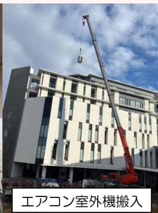
エアコン室外機搬入