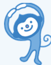
糖尿病協会マスコット：マールくん